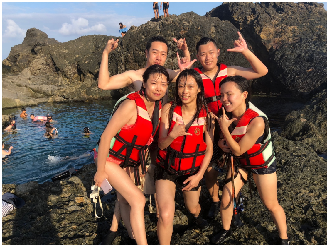
(和台灣朋友一起去綠島旅遊)