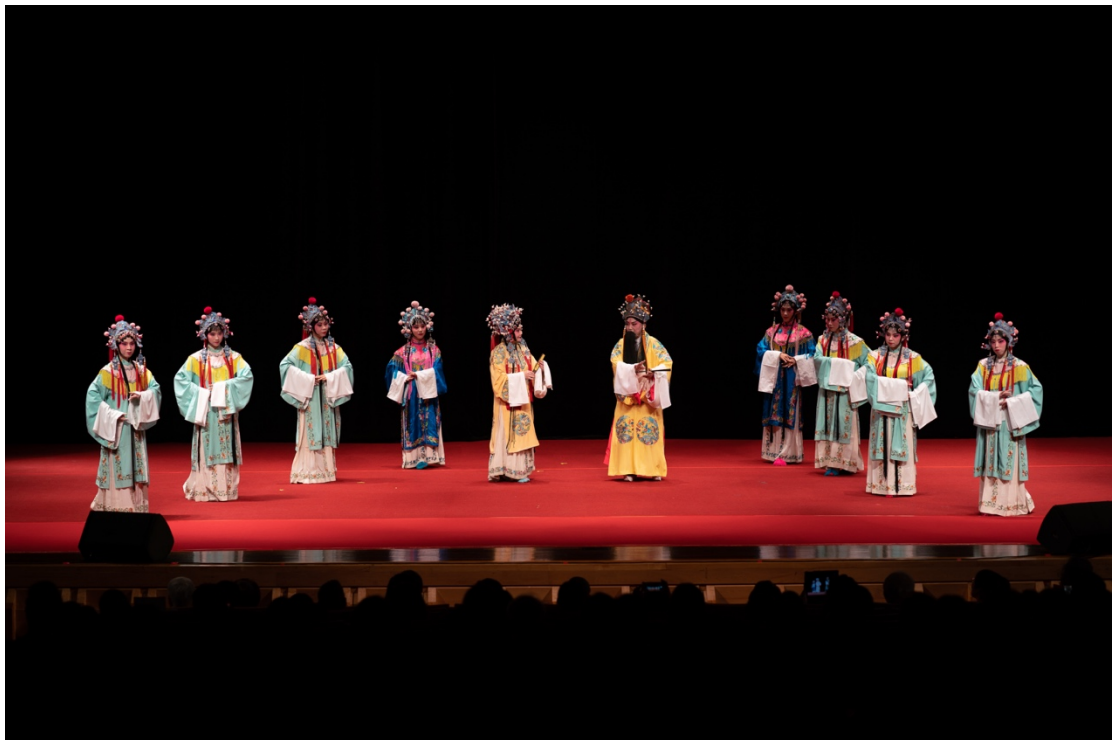
(在成功大學校慶時，參與演出崑劇《長生殿》，右起第四個)